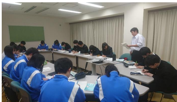
タブレットで問題演習